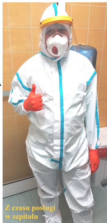
Z czasu posługi w szpitalu

Emocji sporo, tym bardziej że determinuje mnie historia mojego życia i perspektywa - podług aktualnej rachuby, do emerytury pozostała dekada, chociaż przy braku powołań, może to być dłużej. Chciałbym jak najlepiej wykorzystać ten czas dla dobra tej wspólnoty i pomnożenia chwały Bożej. Zbawienie swoje i Wasze jest pierwszorzędnym zadaniem kapłana i o to będę zabiegał. Mam sporo entuzjazmu i zapału, /chyba to widać/, nie mało pomysłów duszpasterskich, jednakże sam nie dokonam zbyt wiele, dzisiejsze czasy dają sporo możliwości osobom świeckim w organizacji życia parafialnego i chciałbym z nich korzystać. To co podkreślam od początku - to jest NASZA PARAFIA, nie moja, nie miejsce gdzie będę realizował siebie czy swoje plany. Boży plan jest jeden i będzie dobrze jeśli go wspólnie będziemy odkrywali i realizowali dla naszej świętości. Liczę na współpracę z Waszej strony, jestem otwarty na propozycje, sugestie, także konstruktywną krytykę. Parafia niewielka liczebnie ma duży potencjał, piękny, duży kościół, wielkie probostwo, obejście i ogród wymagające troski, to w dużej mierze atuty jednak wymagające sporego zaangażowania sił i środków. Pierwszy rok będzie kluczowy jeśli chodzi o pełniejsze rozeznanie: rytm liturgiczny, odwiedziny kolędowe, święta to będzie tworzyło obraz miejsca i wspólnoty.