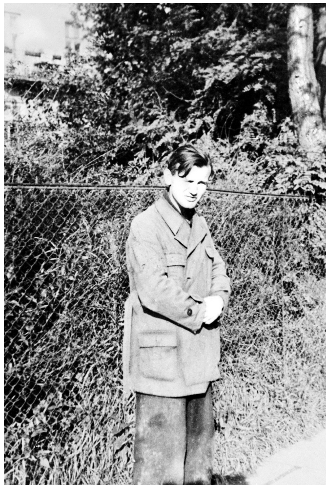
Na zdjęciu: Karol Wojtyła w czasie wojny

W tym czasie ciągle uczył się i brał udział w próbach kilkuosobowego konspiracyjnego Teatru Rapsodycznego, założonego przez znajomego z czasów gimnazjum z Wa-