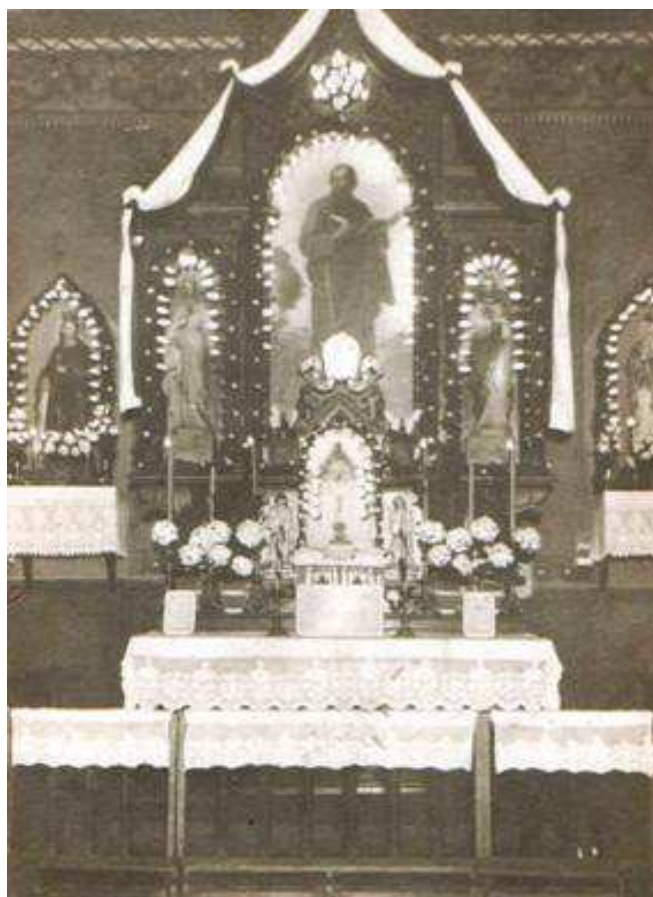
Widok głównego ołtarza

Nowy kościół, choć poświęcony, nie był jeszcze gotowy do pełnego, normalne- go funkcjonowania. Ks. Brejza natych- miast po objęciu urzędu rozpoczął prace wykończeniowe. Należało zadbać o wy- strój wnętrza, zadrzewienie terenu, budo- wę parkanu oraz o budowę probostwa.