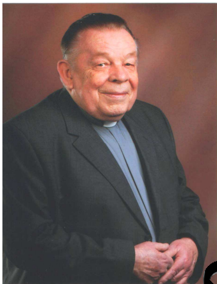
Proboszcz parafii św. Pawła Apostoła w Pawłowie w latach 1967 – 2000

Redaguje zespół parafian. tel. Probostwa 275 14 09, e-mail Redakcji gaz2@interia.pl www.pawel.katowice.opoka.org.pl