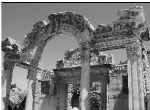
Brama w Efezie

posążki Artemidy, ofiarowywane przez jej wyznawców w świątyni, związany był niemiły incydent. Wiara w jednego Boga, głoszona przez św. Pawła, przyciągała coraz większe rzesze ludzi, co psuło niewątpliwie bujne interesy rzemieślników. Dlatego właśnie wszczęli oni w mieście rozruchy przeciw Pawłowi, które na szczęście szybko wygasły (por. Dz 19,23-40).