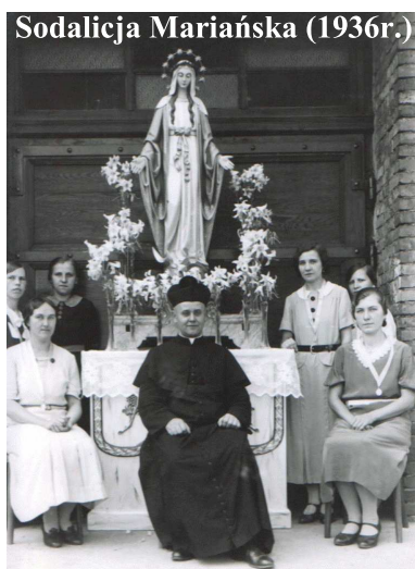
Sodalicja Mariańska (1936r.)