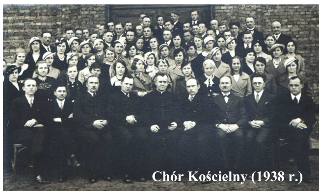
Chór Kościelny (1938 r.)